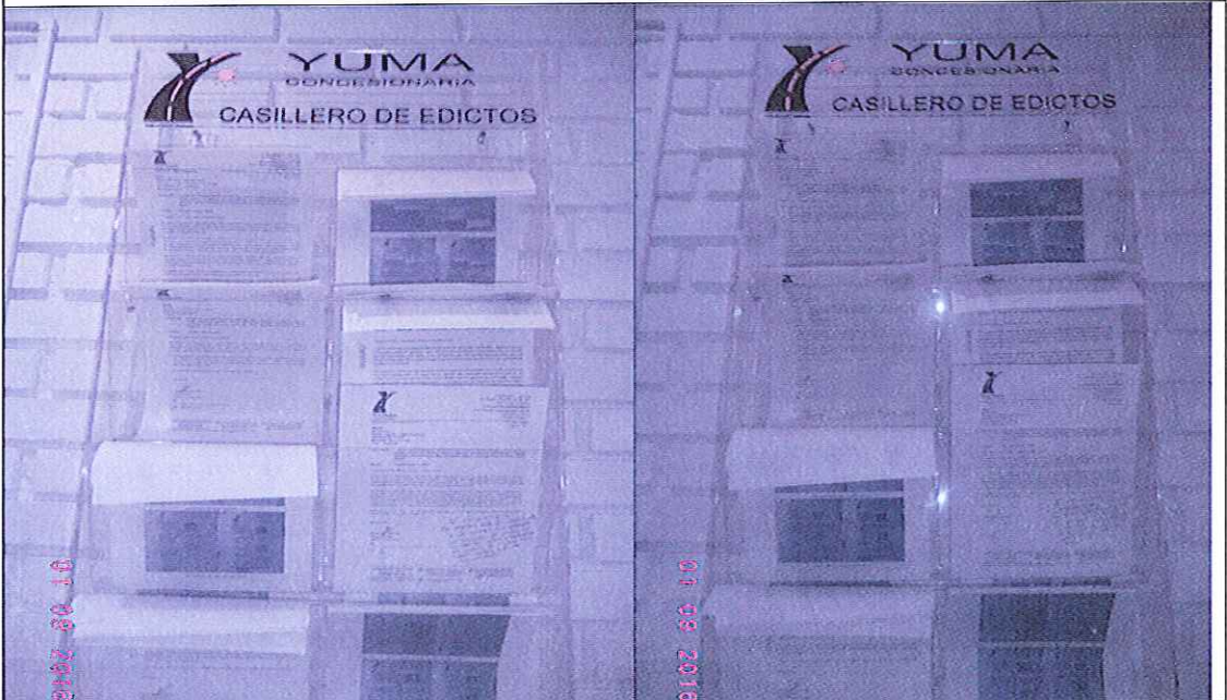
EDICTOS DE LA R_14471 YC-CRT-43083